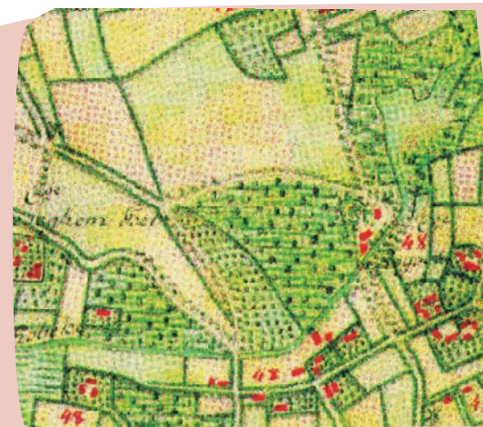
Kaart van Ferraris van 1780

In het Rhodesgoed komt de wandelaar ruimschoots aan zijn trekken. Vanaf het parkeerterrein start er een bewegwijzerde wandeling. Voor de jonge bezoekers is er een speelbos aangelegd van ongeveer 2,5 hectare waar ze vrij kunnen ravotten.